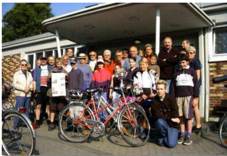
TKSV - Radfahrer vor der Abfahrt zum Start der Wanderfahrt.

Im Mai beteiligten wir uns an der Radwanderfahrt des Bonner General Anzeigers und werden als stärkste Gruppe ausgezeichnet.