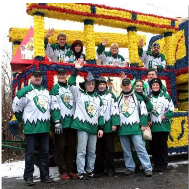
Am Bonner Rosenmontagszug nimmt der Verein mit 2 Festwagen und einer großen Fußgruppe teil.

Unter der Leitung von Anne Hirsch wird das traditionelle Kinderkostümfest in der Sporthalle Schmittstraße durchgeführt.