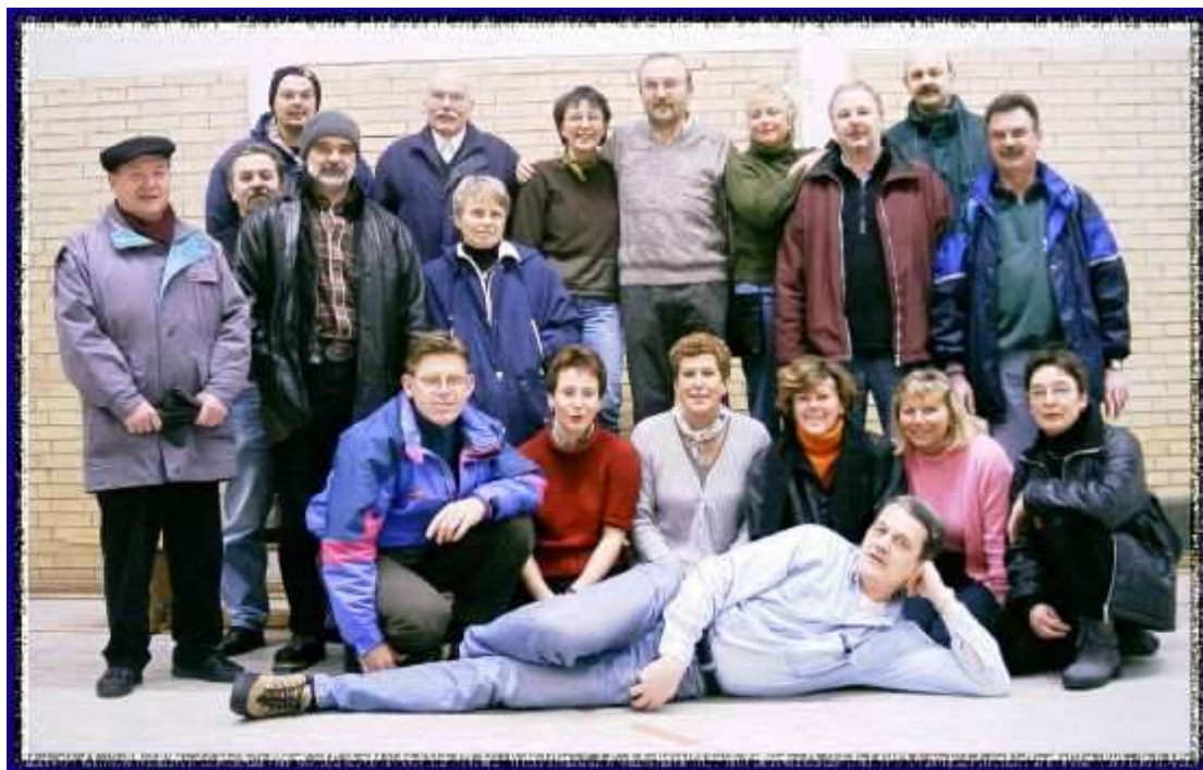
Vorstand + Übungsleiter vor der Nachtwanderung 2001

Ebenso radelt eine Gruppe bei der Radwanderfahrt der Radsportfreunde Duisdorf mit. Der Vorstand „schiebt“ die Räder rund um den Rursee.