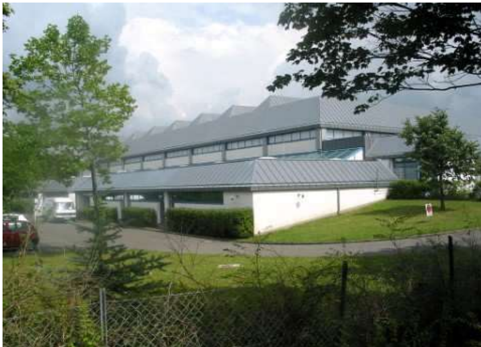
Trainingszentrum der Hardtberghalle

Dank der großzügigen Unterstützung der Stadt Bonn konnte im September 1990 ein hervorragendes Trainingszentrum für die Ringer, in der neuen Hardtberghalle übernommen werden. Neben einem großen Trainingsraum, gehören ein Krafraum, eine Sauna und ein Büro zum Trainingszentrum, das vom Verein, vom Kader des Deutschen Ringerbundes und des Landes genutzt wird.