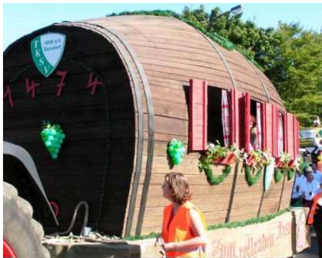
Festwagen I: Das rollende große Faß

Am Festzug nimmt der Verein mit 2 Festwagen und mehreren Fußgruppen teil.