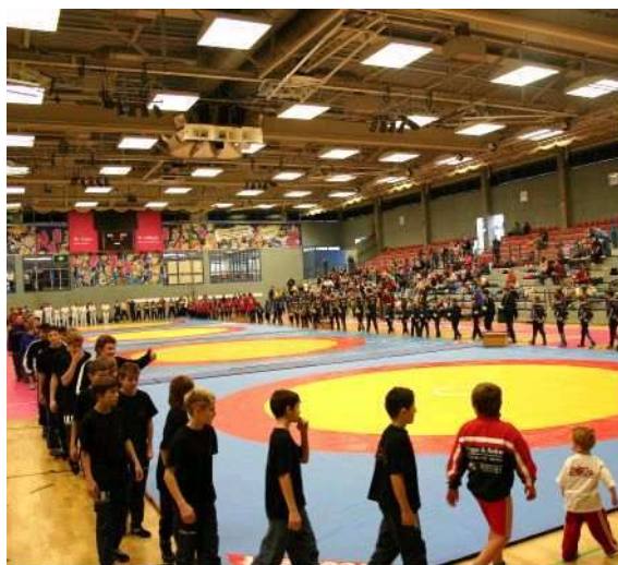
Einmarsch der Teilnehmer in der Hardtberghalle

In der Hardtberghalle findet zum zehnten Male das Willi Boley Gedächtnisturnier für die Ringerjugend des Deutschen Ringerbundes statt.