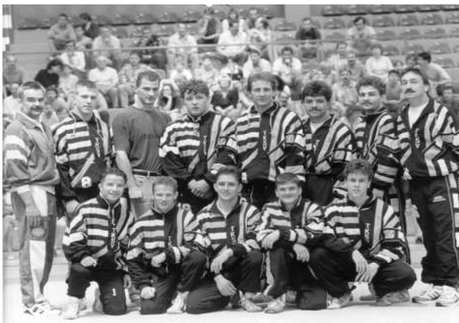
Aufstiegs Mannschaft 1993

Nach kurzem Aufenthalt in der 2. Ringerbundesliga konnte 1993 der Aufstieg in die 1. Bundesliga erreicht werden.