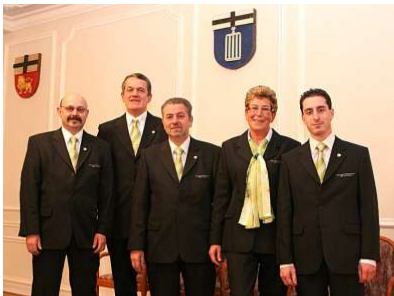
TKSV –Vorstand im Jahre 2006 (von Links):