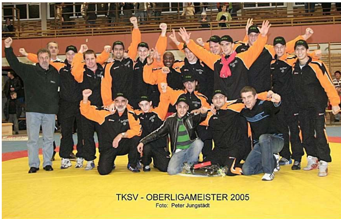
TKSV - OBERLIGAMEISTER 2005

Die Oberligamannschaft des TKSv wurde zu Jahresbeginn gezielt verstärkt und kann ungeschlagen den Titel des Oberligameisters 2005 erringen. Da der DRB seine Bundesligen umstrukturiert, entfällt die Aufstiegsrunde. Die Mannschaft steigt in die 2. Ringerbundesliga West auf.