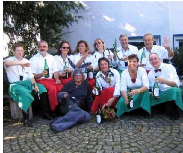
Fußgruppe der Übungsleiter und Mitglieder bei kurzer Rast in der Alte Straße.