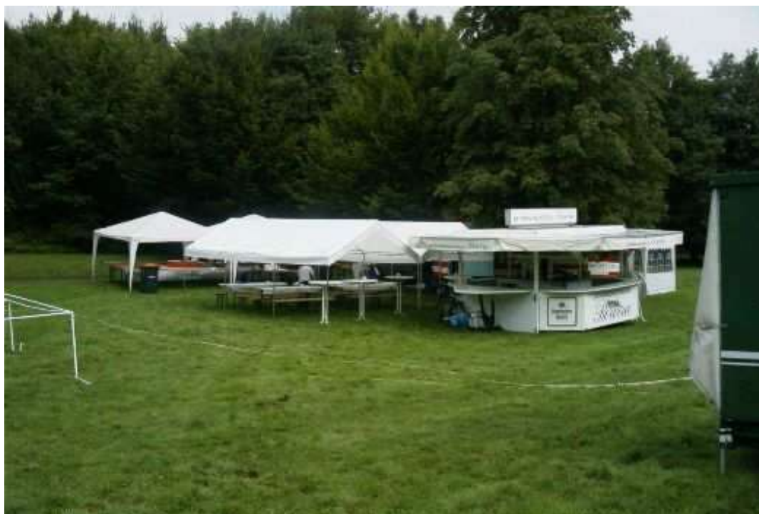
TKSV – Stand beim jährlichen Derletalfest

Nach 3 Jahren in der Oberliga konnten die Ringer zum Abschluss der Saison 1996 den 1. Tabellenplatz erringen. Mit viel Euphorie wurde die Aufstiegsrunde zur 2. Ringerbundesliga West in Angriff genommen. Durch freiwillige Rückzüge anderer Vereine wurden alle Teilnehmer der Runde zum Aufstieg verurteilt.